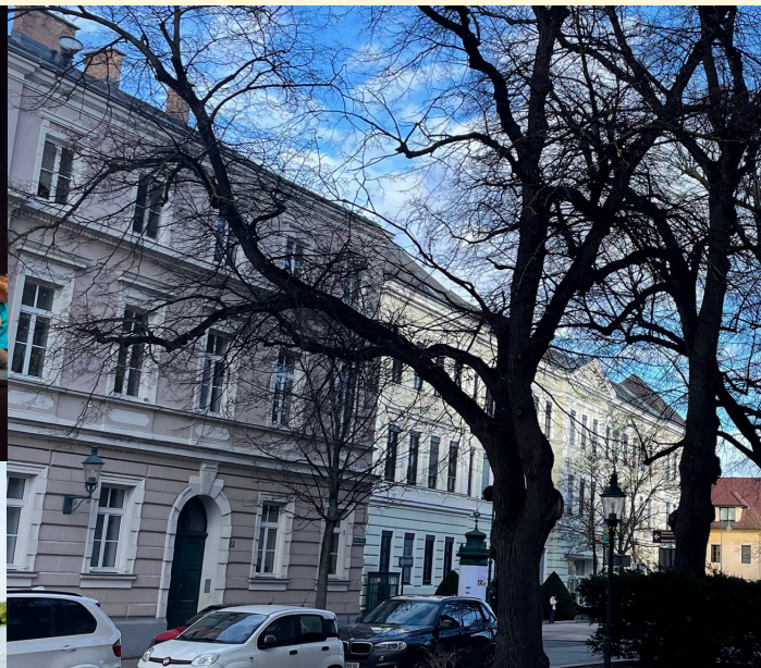
DIE MS MARC AUREL