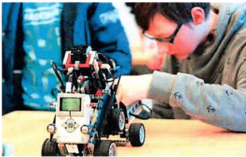
Seit Januar sind die Lego Mindstorms EV3 Roboter in den DAZ-Klassen im Einsatz.

wurde bereits beim NAWI-Tag, einem gemeinsamen Projekttag von ca. 100 Viert- und Fünftklässlern an der Eider-Nordsee-Schule gelegt. Eine von vier Stationen waren die „Lego Mindstorms“ an denen die Kinder gemeinsam mit älteren SchülerInnen des WPU arbeiten konnten. Aufgaben waren das Zusammenbauen einer Legofigur nach Anleitung und einfache Programmierungen am PC (z.B. Ansteuern eines Motors, Geräusche erzeugen). Außerdem gab es eine kleine Projektpäsentation von drei Neuntklässlern, die einen Treppensteiger