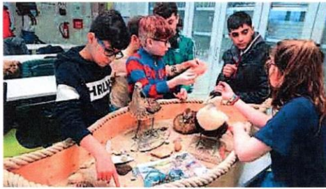
Die DaZ-Klasse wurde umfangreich zum Thema Wattenmeer informiert.

Hautnahes Erleben der lebendigen Bewohner des Wattenmeeres