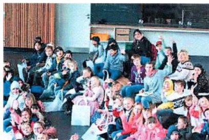
Teilnehmende Viertklässler der Grundschulen aus Wesselburen und Neuenkirchen.

Nawi-Forschungstag sollten somit die Viertklässler die drei Fächer kennenlernen. Die Lehrkräfte überlegten sich dafür wieder spannende und knifflige Experimente, welche mit Begeisterung ausprobiert und getestet