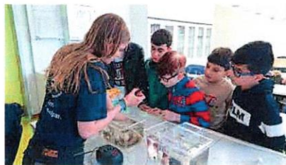
Lebendige Bewohner des Wattenmeeres wurden vorgestellt und konnten sogar angefasst werden.

wann hat man schon mal die Möglichkeit, einen Einsiedlerkrebs zu sehen oder einen Seeigel anzufassen? Dies wäre nicht möglich gewesen ohne die motivierten und engagierten MitarbeiterInnen der „Schutzstation Wattenmeer“. Trotz sprachlicher Schwierigkeiten seitens der SchülerInnen haben sie es geschafft, ihnen viel zu vermitteln. Sobald das Wetter besser wird, geht es für die DaZ-Klasse mit dem Team der Schutzstation ins Watt, um diese einzigartige Natur kennenzulernen. (vr)